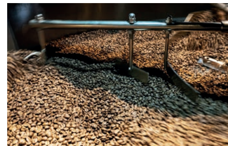
Dallmayr seit 1700 in München Dallmayr – in Munich since 1700